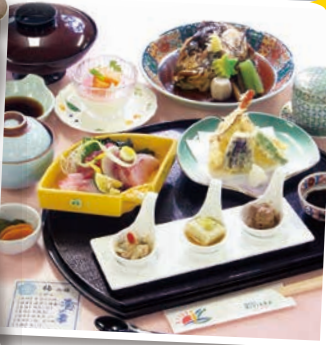
阿波尾鶏骨付きもも肉テリヤキ ※写真はイメージです

通常の料理に加え、クリスマス限定 メニューとして阿波尾鶏の照り焼き とクリスマスケーキが付きます。