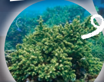
昼間のエダミドリイシサンゴ